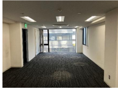
改装前のオフィス②