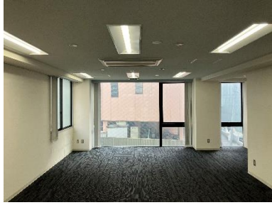
改装前のオフィス①