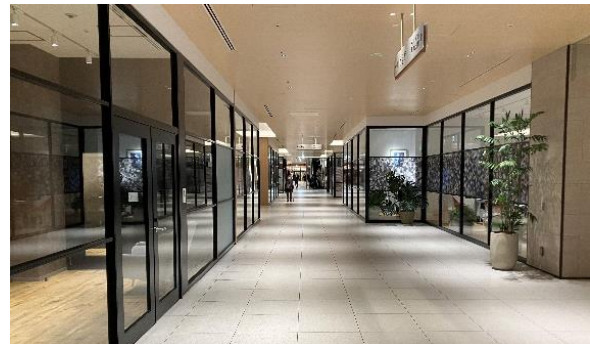
恵比寿ガーデンプレイス センタープラザ（外観・B1 オフィス）