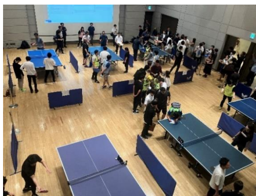
プログラムの一例（恵比寿文化祭2023、恵比寿ガーデンプレイス ワーカー限定卓球大会）