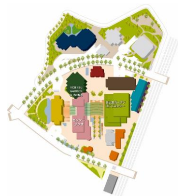
恵比寿ガーデンプレイス MAP