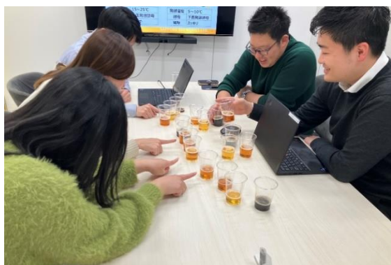
<ワークショップイメージ>