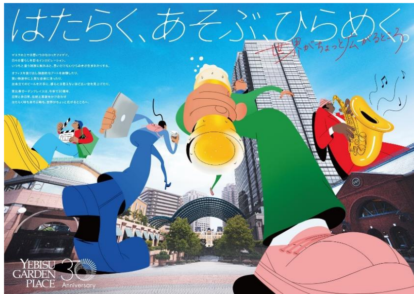
新コンセプトキービジュアル