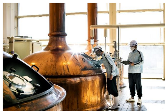
<ビール醸造イメージ>