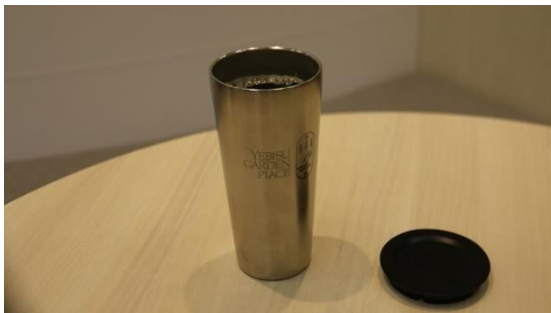
容器シェアリングサービスで提供する飲料用容器

サッポロ不動産開発株式会社（本社：東京都渋谷区、代表取締役社長：宮澤 高就）は、飲料用のPETボトルや紙コップなどの使い捨て容器の削減を目指し、2023年9月1日（金）より当社が運営する恵比寿ガーデンプレイス（東京都渋谷区）にて、同施設内ワーカーを対象としたステンレス製の飲料用容器のシェアリングサービスの実証実験を実施します。