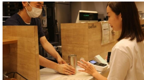
カフェ店舗での容器シェアリングサービスの利用イメージ

環境に配慮した暮らしの重要性や意義について生活者の理解や意識が高まってきている中、飲料用使い捨て容器の削減や飲料代の節約を目的としてマイボトルやマイカップ ※1 を使用する人が増加しています。一方で、そうしたマイボトルやマイカップは環境面や経済面での利点があるものの、持ち運びによる不便さや洗浄の手間を感じることから、継続利用を諦めてしまうことが知られています。そこで、オフィス出勤時にいつでも自由に清潔な容器を借りることができ、持ち運びや洗浄の手間がなく、自分が飲みたい飲料を楽しんでいただける飲料用容器のシェアリングサービスの事業展開を目指し、実証実験を行います。