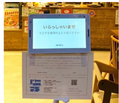
「AWL Lite」10 インチタブレット店舗設置イメージ

本実証実験では、AWL 株式会社のAI カメラソリューション「AWL Lite」をサッポロファクトリーに導入して実施します。施設内飲食店入口にAI 搭載カメラ「AWL Lite」10 インチタブレットを設置して店舗の混雑状況を取得し、サッポロファクトリー内の通路に設置したデジタルサイネージ上に表示します。また、デジタルサイネージに設置したAI 搭載カメラ「AWL Lite」STB 型端末を用いてデジタルサイネージの視聴者分析を行い、視聴者に対して視聴者の属性に合わせた最適な各店舗のおすすめメニューを表示し、飲食店舗への自発的な回遊行動を促します。