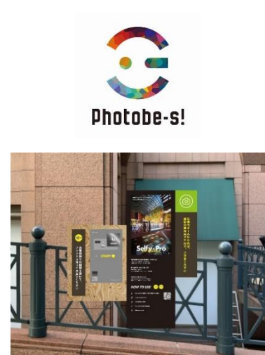
専用端末イメージ画像

スマートフォンやSNSの普及により、いつでも手軽に写真を撮れるようになった昨今、若年層を中心に写真をシェアする機会が増え、その時その場所での思い出を記録に残したいというニーズが高まっています。当社が運営する「恵比寿ガーデンプレイス」は、恵比寿のまちのランドマークであるとともに、ヨーロッパの街並みをイメージした象徴的な建築物や風景美を有しており、竣工からまもなく28年を迎える今なお、年間を通じて多くの皆様に訪れていただいています。そうしたニーズと「恵比寿ガーデンプレイス」を象徴する風景を掛け合わせ、フォトスポットの有料サービス「セルフイープロ with フォトビーズ！」展開に向けた実証実験を恵比寿ガーデンプレイスのセンター広場で実施します。