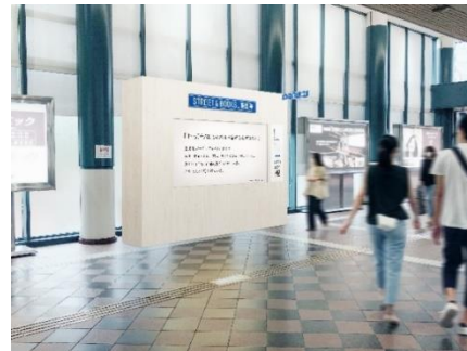
デジタルサイネージ設置イメージ

本事業は、デジタルサイネージで展開する、街を舞台にしたブックレーベルという新たな出版事業のビジネスモデル開発を目指した取り組みで、第一回目の実証実験は、動く通路「恵比寿スカイウォーク」にデジタルサイネージを設置し、物語を放映します。1日1話または2話ずつ物語が進行し、14日間でストーリーは完結。恵比寿ガーデンプレイスをはじめ、スタイリッシュなショップやモダンな建物がある一方、下町の雰囲気も感じられる恵比寿を舞台に、芥川賞作家・平野啓一郎氏、SNSを中心に活動されている漫画家・吉本ユータヌキ氏による書き下ろしの作品を展開します。