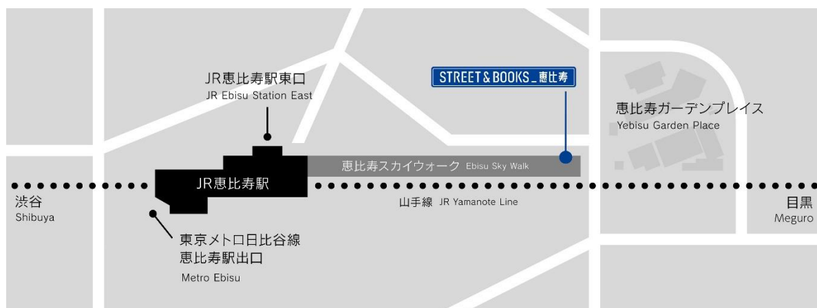
デジタルサイネージ設置場所