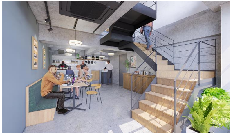
<地下1階・1階イメージ>

メゾネットタイプで飲食・物販などのショップやショールーム型のオフィスとして利用が可能。