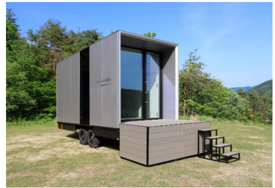
トレーラーハウス「mobileCLASCO」(イメージ)