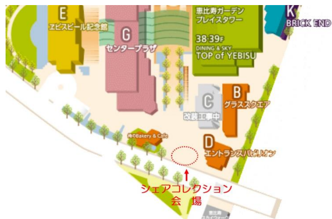
恵比寿ガーデンプレイス MAP