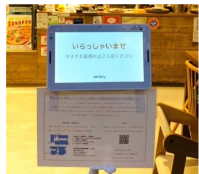
「AWL Lite」10 インチタブレット店舗設置イメージ

本実証実験では、AWL 株式会社の AI カメラソリューション「AWL Lite」をサッポロファクトリーに導入して実施します。施設内飲食店入口に AI 搭載カメラ「AWL Lite」10 インチタブレットを設置して店舗の混雑状況を取得し、サッポロファクトリー内の通路に設置したデジタルサイネージ上に表示します。また、デジタルサイネージに設置した AI 搭載カメラ「AWL Lite」STB 型端末を用いてデジタルサイネージの視聴者分析を行い、視聴者に対して視聴者の属性に合わせた最適な各店舗のおすすめメニューを表示し、飲食店舗への自発的な回遊行動を促します。