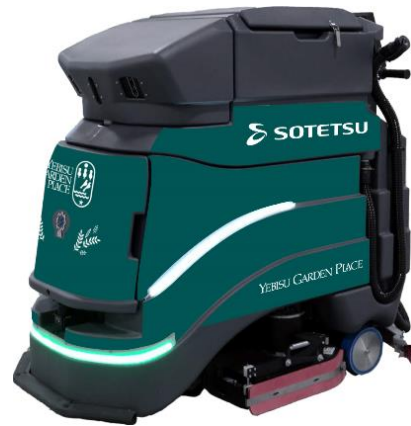
自動清掃ロボット「ネオ」

当社では、新型コロナウイルス感染症により利用者の衛生意識が高まる中、施設運営にご協力いただいている相鉄企業をはじめとするパートナー企業の方々とともにお客様のニーズに応えること、また、パートナー企業の新しい取り組みを積極的に受け入れることで、時代に即した安心・安全な施設運営を目指します。