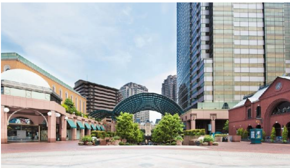
恵比寿ガーデンプレイス

恵比寿ガーデンプレイスは、1994年の開業以来、住宅・オフィス・ホテル・文化施設などを有するワンランク上の上質な暮らしをお届けする複合商業施設として年間約1,300万人の来街者をお迎えしてきました。人々のライフスタイルの多様化が進み、日々変化する日常に新たな価値が求められる未来に向けて、2022年「暮らす」「働く」「遊ぶ」が融合した新しい「すごしかた」を創造するまちに生まれ変わります。