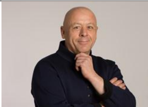
<ティエリー・マルクス氏>

フレンチの基本を大切にしながらも、先進的料理技法による新しい美食を迫及している料理人です。ブーランジェリー（パン職人）としてパンの製造も得意としています。2006年に有名なレストランガイド「ゴー・エ・ミヨ」で今年のシェフにも選ばれ、「星の請負人」の異名を持っています。ストリートフード協会を率い、食を通じて積極的に社会貢献活動を展開しています。大の親日家でもあり武道の精神を大切に柔道、剣道、合気道も修めています。