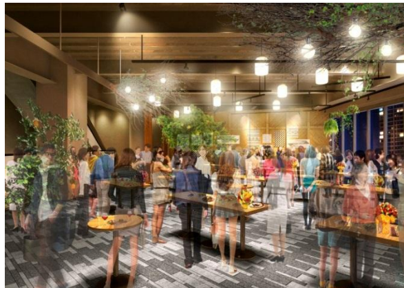
<「GINZA PLACE CAFE（仮称）」イメージ>

施設3階にオープンするイベントスペース&カフェ「GINZA PLACE CAFE（銀座プレイスカフェ）（仮称）」は、「発信と交流の拠点」を象徴する場として、様々な形でご利用いただけるイベントスペースとして発信を行ってまいります。イベントを実施しない通常時は、上質な空間とお食事やドリンクをお楽しみいただけるカフェとして営業いたします。イベント利用に関するお問い合わせは本日6月15日より受け付けを開始します。詳細は「GINZA PLACE」公式サイト ( http://ginzaplace.jp/ ) をご覧ください。